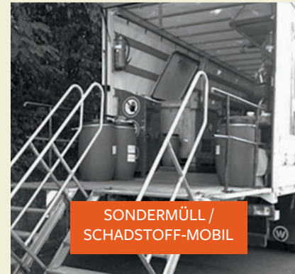
SONDERMÜLL / SCHADSTOFF-MOBIL