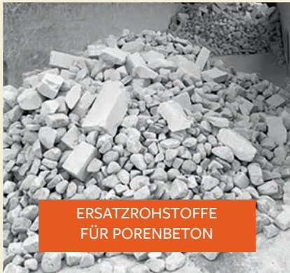
ERSATZROHSTOFFE FÜR PORENBETON