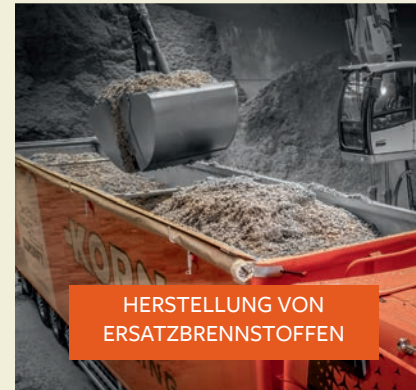
HERSTELLUNG VON ERSATZBRENNSTOFFEN