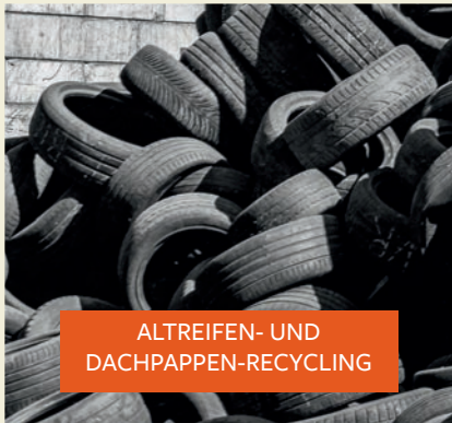
ALTREIFEN- UND DACHPAPPEN-RECYCLING