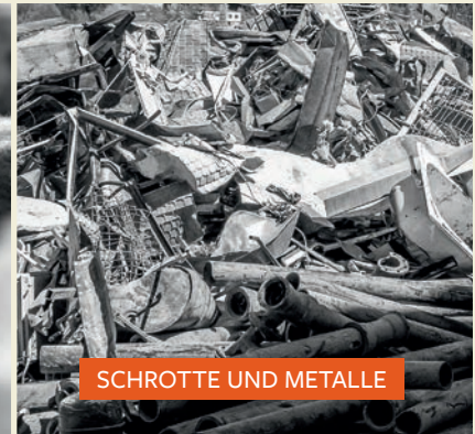
SCHROTTE UND METALLE